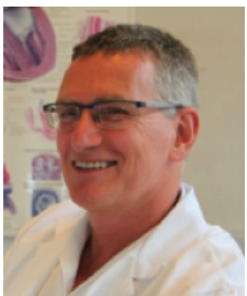
Sehr geehrte Ärztinnen und Ärzte,

mit unserem neuen Newsletter „Ordination und Reha“ wollen wir Sie regelmäßig über die medizinischen und therapeutischen Angebote unseres Hauses informieren.